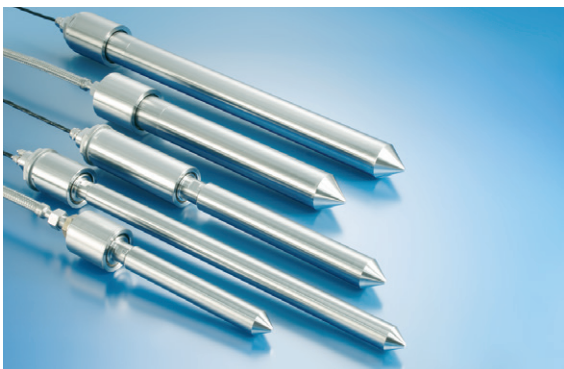
SONOPUSH MONO® / SONOPUSH MONO HD®

SONOPUSH MONO HD® Stabschwinger zeichnen sich durch ein Maximum an Betriebssicherheit aus. Dazu leistet die Ausstattung mit nur einem Schallerreger einen wichtigen Beitrag. Sie minimiert einerseits das Risiko, dass Flüssigkeit eindringt. Die durchgehend glatte Oberfläche des Schwingers wirkt Schmutzablagerungen entgegen. SONOPUSH MONO HD® Schwinger sind in Verbindung mit Ultraschall-Generatoren von Weber Ultrasonics absolut trockenlaufsicher.